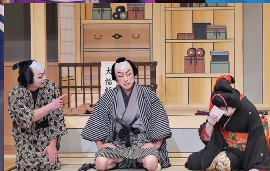
美濃歌舞伎保存会（瑞浪市）

主催／（公財）岐阜県教育文化財団 共催／岐阜県 協力／岐阜県地歌舞伎保存振興協議会