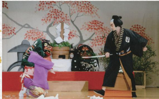
白山比咩神社獅子舞保存会