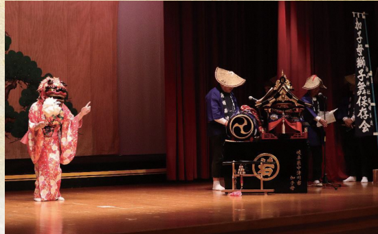
加子母獅子芝居保存会