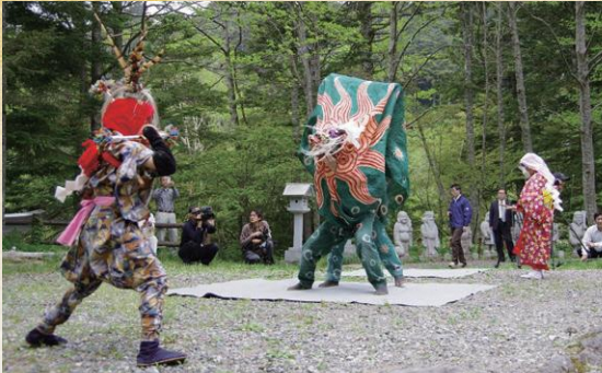
津島神社金蔵獅子保存会