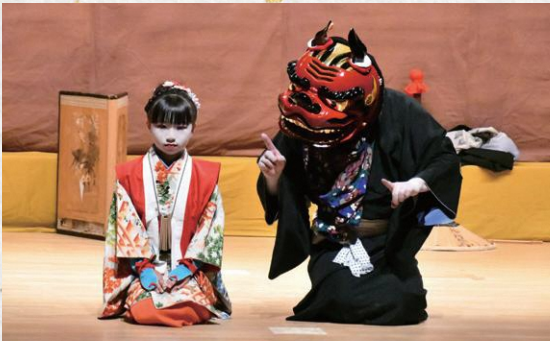
岐南町伏屋獅子舞保存会